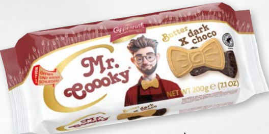
Mr. Cooooky Dark choco