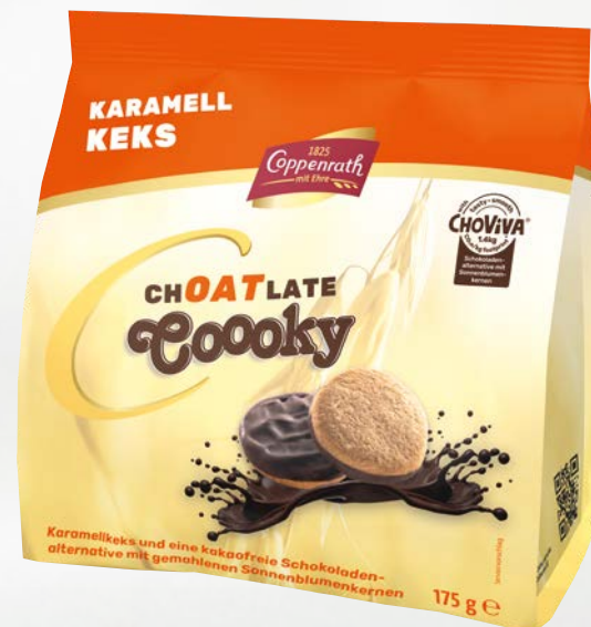
chOATlate Cooky Karamell

Erhältlich in den Sorten: Hafer Vollkorn Vanille Karamell.