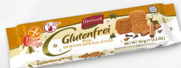
Glutenfrei Mini Gewürz-Spekulatius