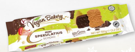
Vegan Bakery Mini Spekulatius Schoko