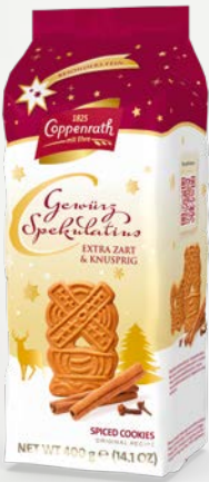
Gewürz Spekulatius 400 g