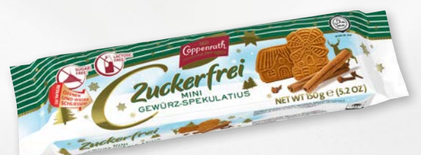
Zuckerfrei Mini Gewürz-Spekulatius