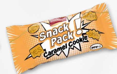
Snack Pack Caramel Cookie