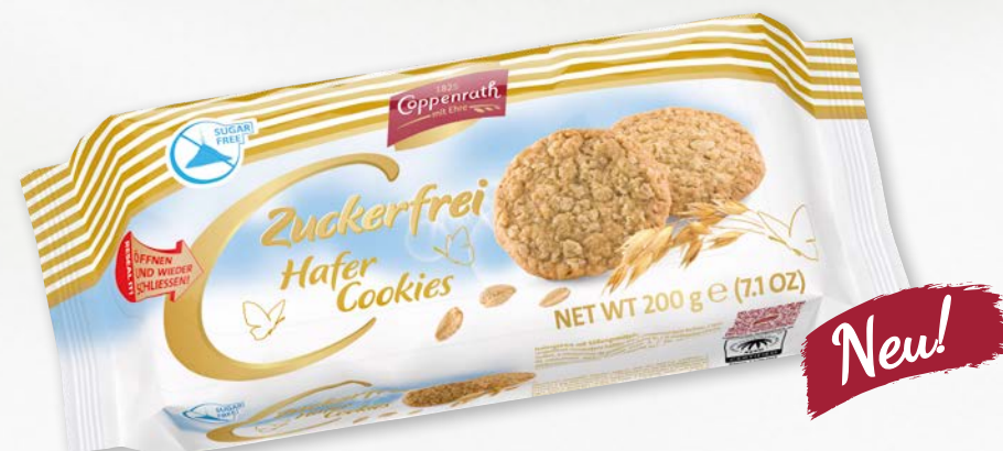
Zuckerfrei Hafer Cookies