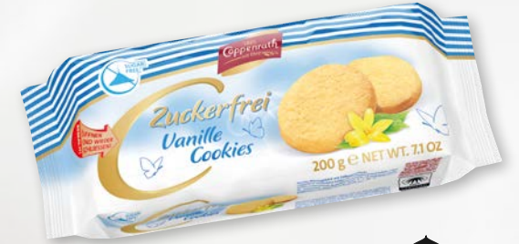
Zuckerfrei Vanille Cookies