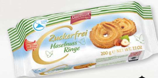
Zuckerfrei Haselnuss Ringe