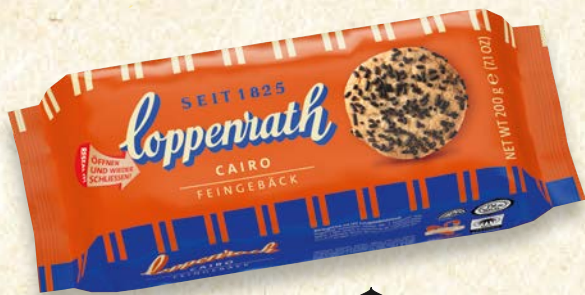
Cairo Mürbegebäck mit Schokostreuseln

Die Produkte unseres Feingebäck-Sortiments bringen die Werte des Hauses Coppenrath auf den Punkt: Qualität, Tradition und Nachhaltigkeit.