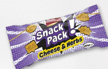
Snack Pack Cheese & Herbs