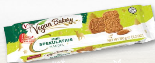
Vegan Bakery Mini Spekulatius Mandel