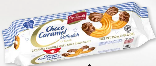
Choco Caramel Vollmilch