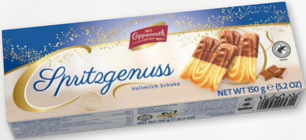
Spritzgenuss Vollmilch Schoko