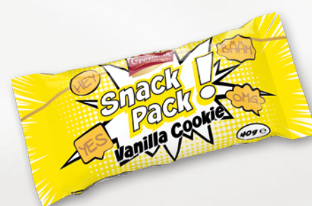
Snack Pack Vanilla Cookie