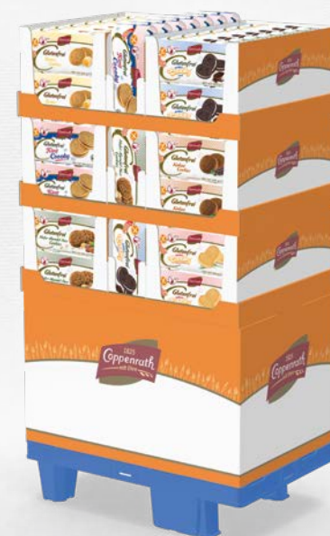
1/4-Chep-Palette mit Sockel