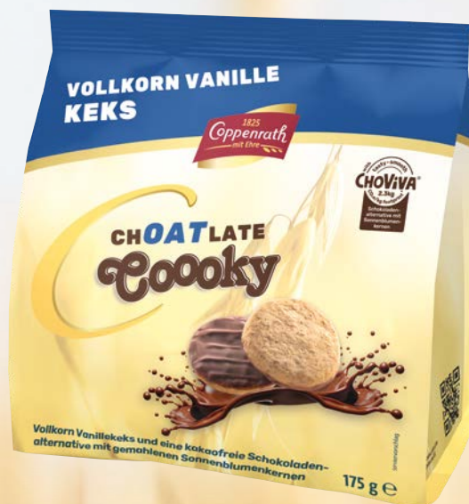
chOATlate Cooky Vollkorn Vanille