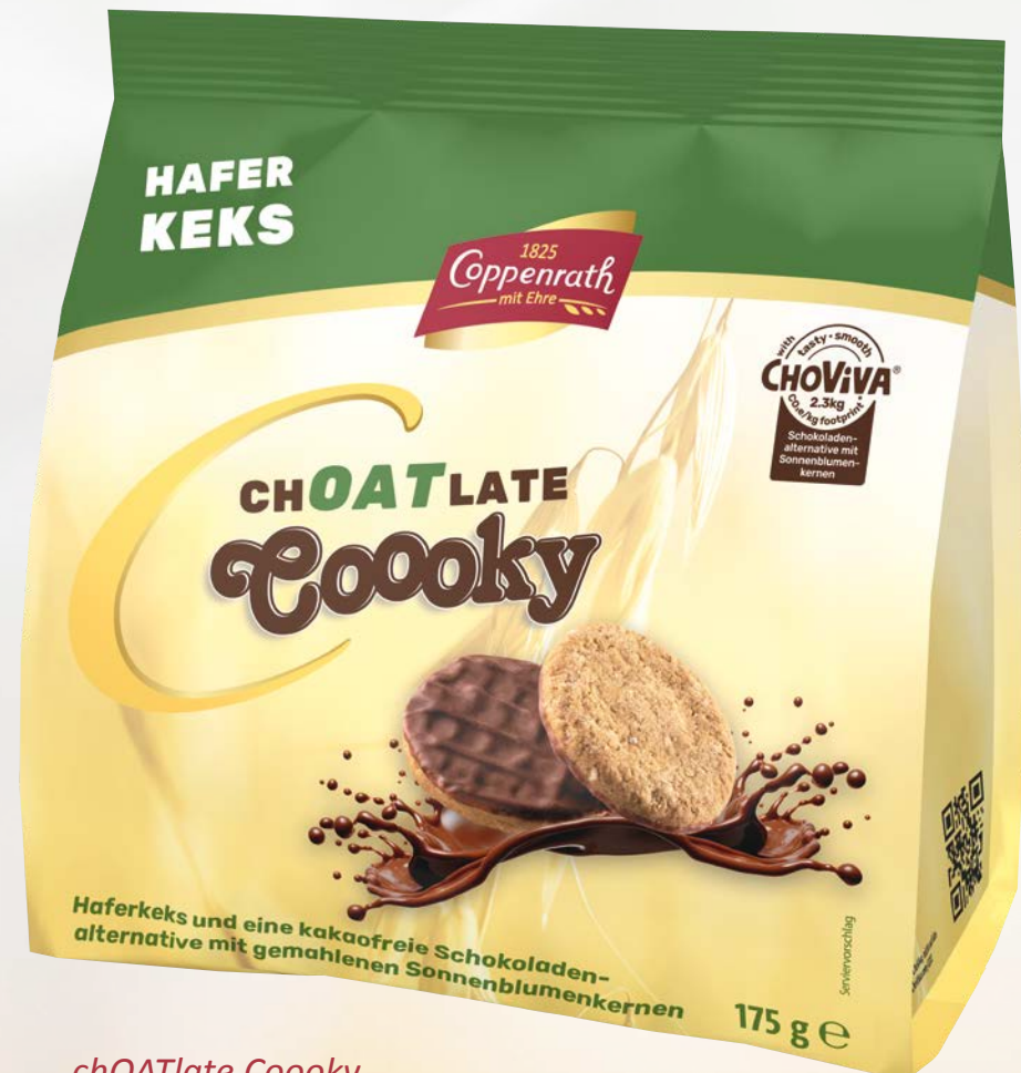
chOATlate Cooky Hafer