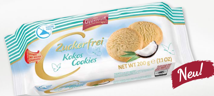
Zuckerfrei Kokos Cookies

Bewusst leben und dennoch genießen - unsere zuckerfreien Gebäcke beweisen, dass ein volles und knuspriges Geschmackserlebnis auch sehr gut ohne den Einsatz von Zucker möglich ist. Einfach probieren und genießen.