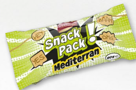
Snack Pack Mediterran