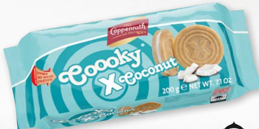
Cooooky x Coconut