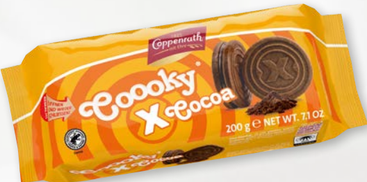
Cooooky x Cocoa