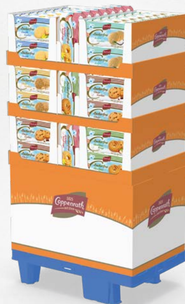
1/4-Chep-Palette mit Sockel