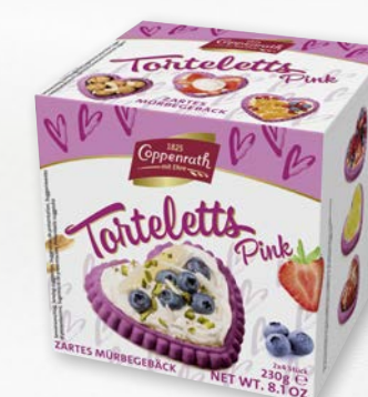
Mürbe-Torteletts Herz Pink