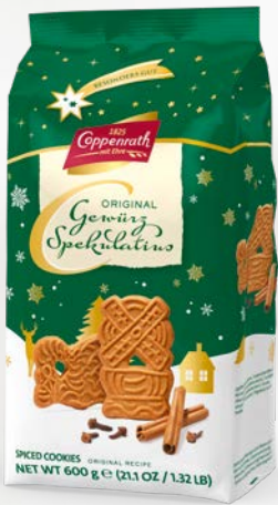
Gewürz Spekulatius 600 g