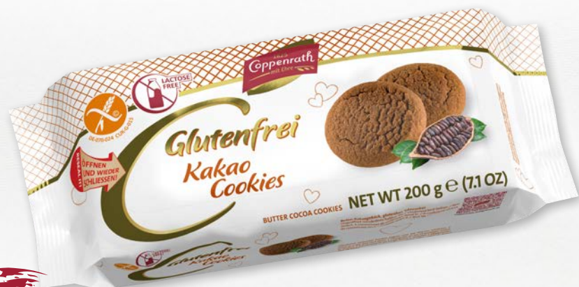
Glutenfrei Kakao Cookies