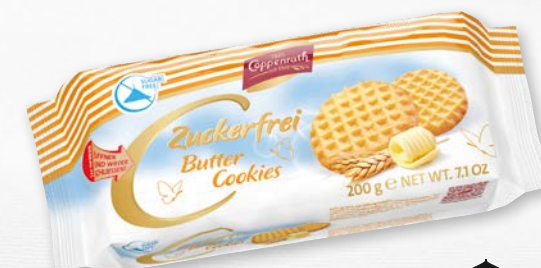
Zuckerfrei Butter Cookies