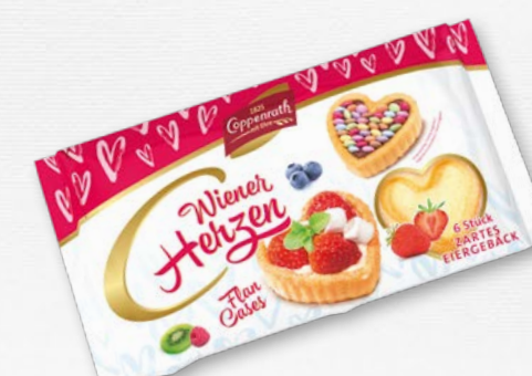
Wiener Torteletts Herzen