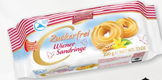
Zuckerfrei Wiener Sandringe