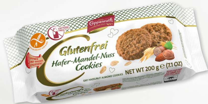
Glutenfrei Hafer-Mandel-Nuss Cookies

Dank spezieller Rezepturen bieten wir Ihnen ein unvergleichliches Geschmackserlebnis, das nicht nur für Menschen mit Glutenunverträglichkeit geeignet ist, sondern für alle, die Wert auf bewusste Ernährung legen. Gönnen Sie sich köstliche Momente, ganz ohne Gluten.