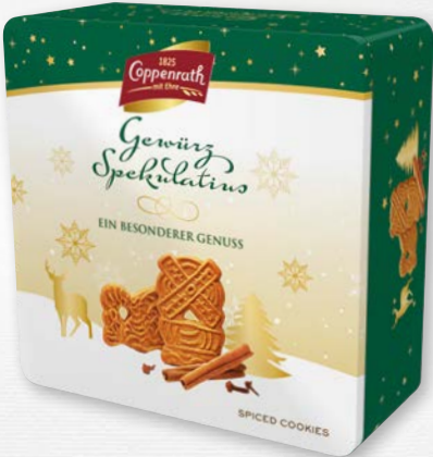
Gewürz Spekulatius Dose Grün 1 kg