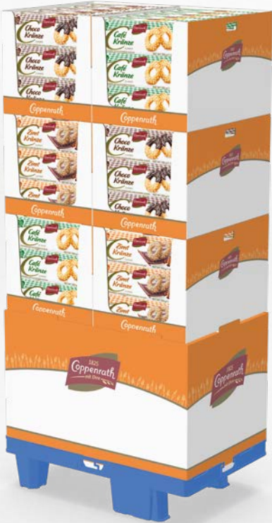
1/4-Chep-Palette mit Sockel