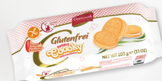
Double Cooky Doppelkeks