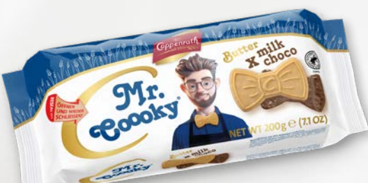
Mr. Cooooky Milk choco