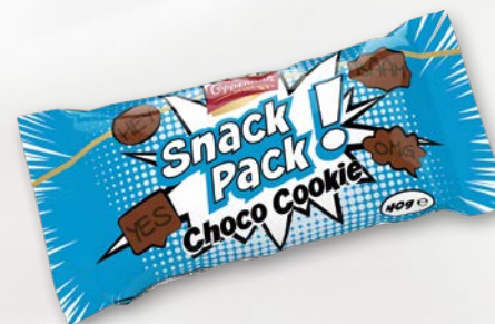
Snack Pack Choco Cookie