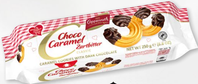
Choco Caramel Zartbitter