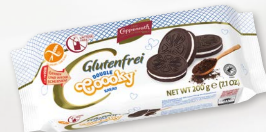
Double Cooky Kakao-Doppelkeks

ÖFFNEN UND WIEDER SCHLIESSEN! RESEAL IT!