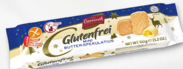
Glutenfrei Mini Butter-Spekulatius