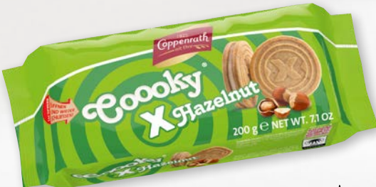
Cooooky x Hazelnut