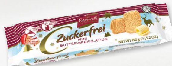
Zuckerfrei Mini Butter-Spekulatius