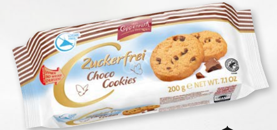
Zuckerfrei Choco Cookies