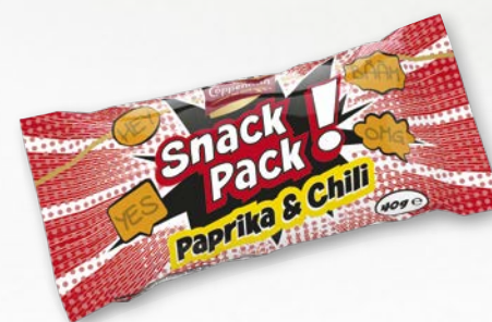
Snack Pack Paprika & Chili