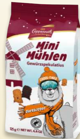
Mini Mühlen Zartbitter Mini mills dark chocolate