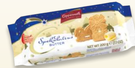
Spekulatius Butter Butter Spekulatius