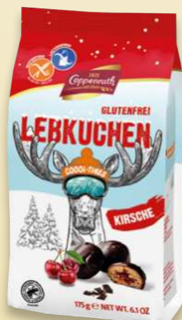
Lebkuchen gefüllt mit Kirsche Gingerbread filled with cherry