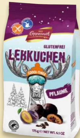
Lebkuchen gefüllt mit Pflaume Gingerbread filled with plum