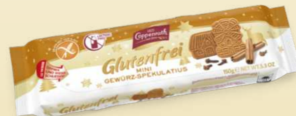
Glutenfrei / Gluten free Mini Gewürz-Spekulatius / Mini spiced Spekulatius