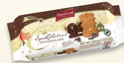
Spekulatius Schokolade Chocolate Spekulatius