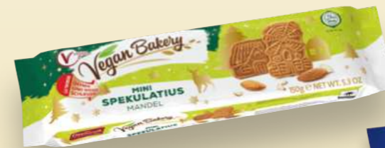
Vegan Bakery Mini Spekulatius Mandel Mini almond Spekulatius