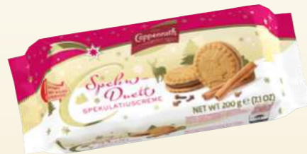
Speku-Duett Spekulatiuscreme Spekulatius sandwich Spekulatius cream