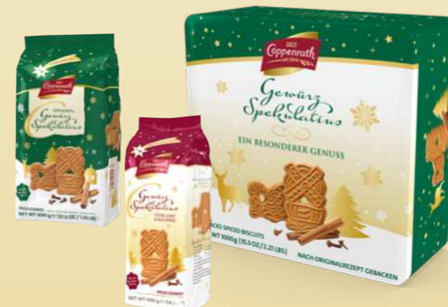
Gewürz Spekulatius Dose Spiced Spekulatius tin 400 g + 600 g