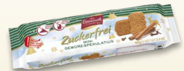
Zuckerfrei / Sugar free Mini Gewürz-Spekulatius / Mini spiced Spekulatius