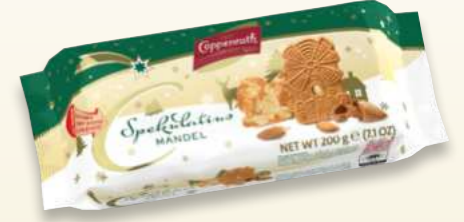
Spekulatius Mandel Almond Spekulatius