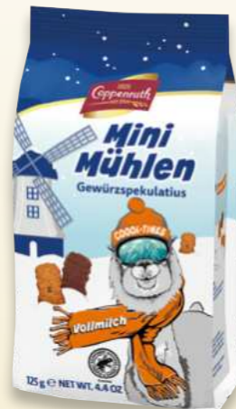
Mini Mühlen Vollmilch Mini mills milk chocolate