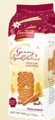
Gewürz Spekulatius Spiced Spekulatius 400 g