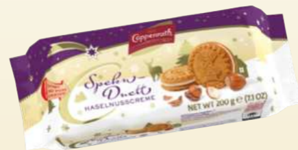
Speku-Duett Haselnusscreme Spekulatius sandwich hazelnut cream