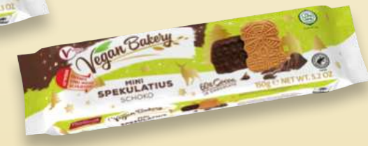
Vegan Bakery Mini Spekulatius Schoko Mini chocolate Spekulatius