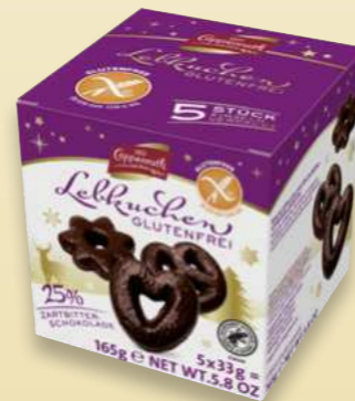
Glutenfrei / Gluten free Lebkuchen / Gingerbread