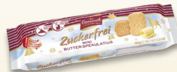
Zuckerfrei / Sugar free Mini Butter-Spekulatius / Mini butter Spekulatius