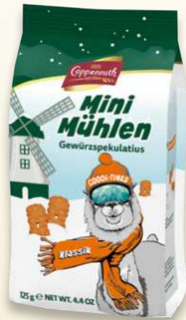
Mini Mühlen Klassik Mini mills classic