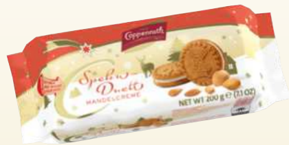
Speku-Duett Mandelcreme Spekulatius sandwich almond cream