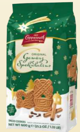
Gewürz Spekulatius Spiced Spekulatius 600 g