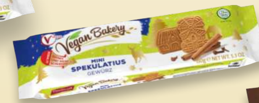
Vegan Bakery Mini Spekulatius Gewürz Mini spiced Spekulatius