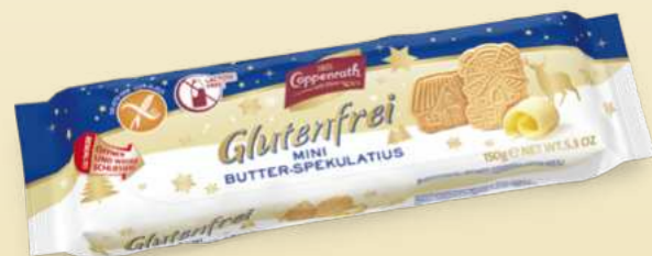
Glutenfrei / Gluten free Mini Butter-Spekulatius / Mini butter Spekulatius